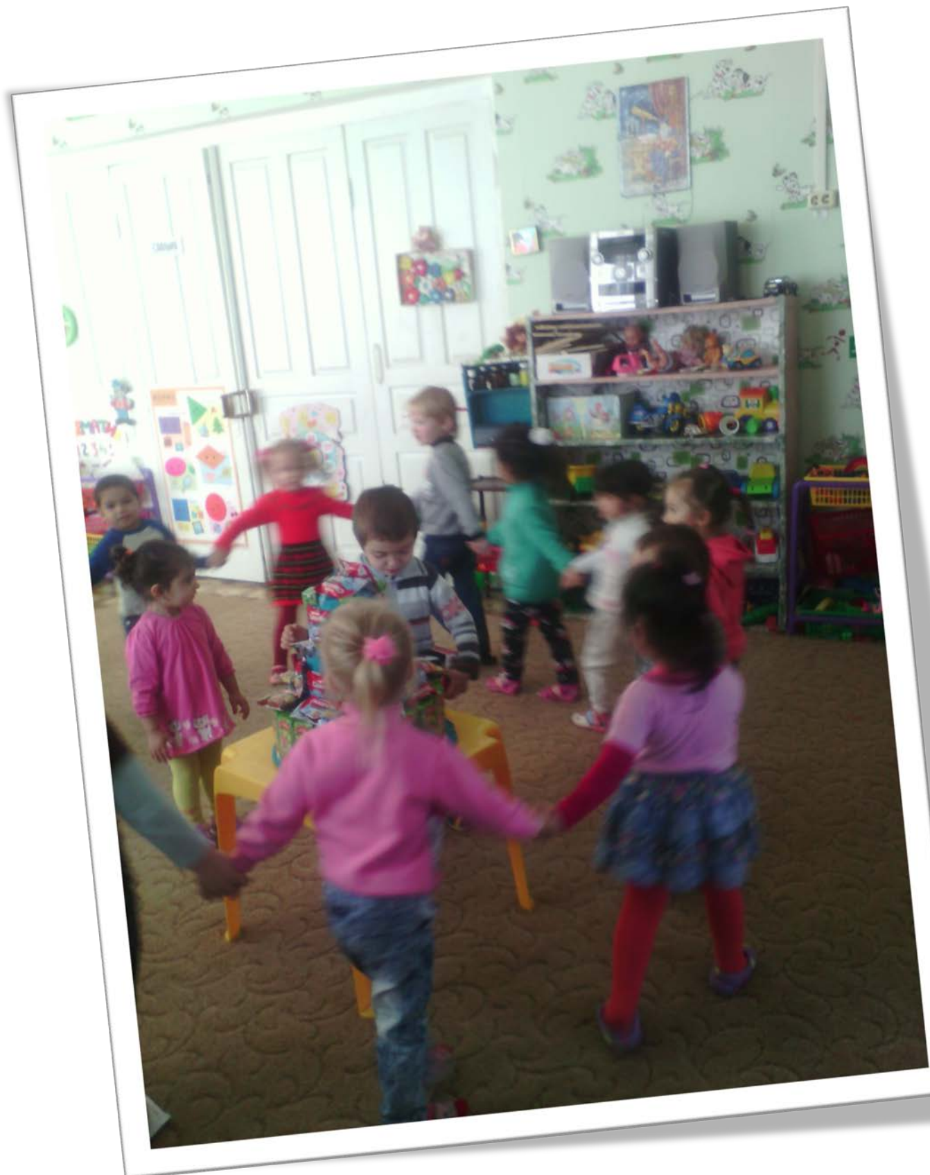
Дети исполняют песню-танец «Каравай»